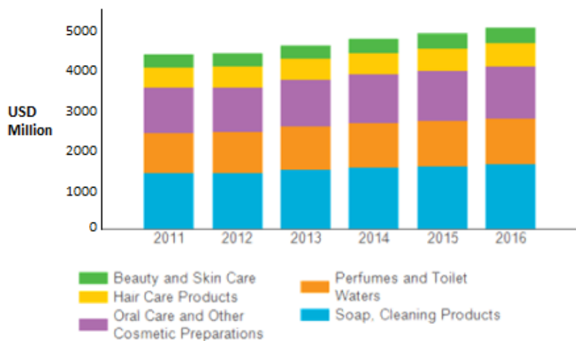
Household Cleaning and Personal Care Products Production (turnover) MSP - Mexico 2011 - 2016